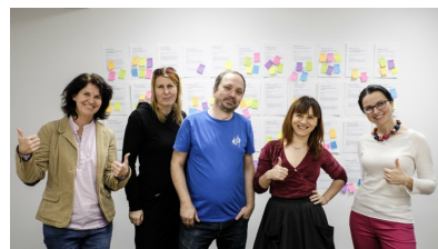
▲ Jury wyłoniło zwycięskie pomysły na projekty edukacyjne.

Kolejnych 15 pomysłów wybrali internauci w odrębnym głosowaniu. Łącznie przyznanych zostało więc 75 grantów finansowych, które pomogą zmienić naukę w przygodę. Serdecznie gratulujemy uczestnikom i laureatom!